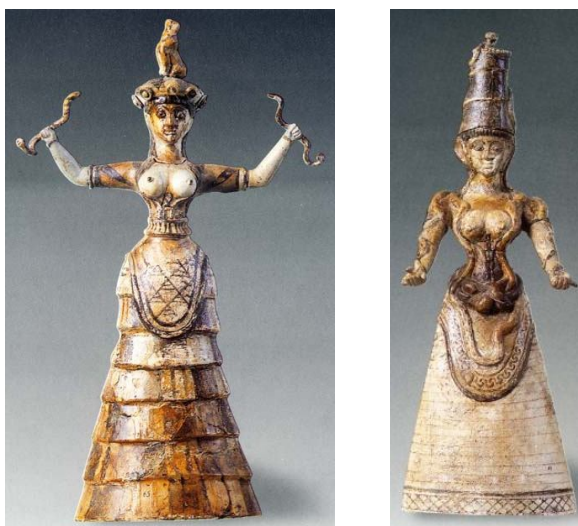
Рис. 1. Богини, Крит, ок. 1600 до н.э. Слева фигура с обнаженной грудью держит в руках двух змей, которые ей подвластны. На ее фартуке в стилизованной форме изображены вулканические горы (Аралатские горы). Справа фигура с открытыми ладонями, обращенными к небесам, возносит молитву к своему небесному спасителю

По мнению авторов, все мотивы статуэток, а также особый стиль, в котором они были изготовлены, указывают на их древнеармянское происхождение. Мотивы статуэток ассоциируются с мотивами армянской Астхик. Змеи отражают следы подвига Ваагна-драконоборца/змееборца (змеи олицетворяют силы зла, тьмы и смерти/катастрофических извержений вулканов и сход лав, зажатые в руках богини они уже не представляют опасности. Богиня властвует над змеями. Ваагн первым бросил вызов змеям/драконам, победил их, освободив Астхик и все человечество, животный и растительный мир от гибели. Этот мотив свидетельствует о победе человека над дикими силами природы) и являются когнитивным архаичным ключом к пониманию роли и значения Богини-Матери – Астхик/Иштар/Астарты – невесты Ваагна [70]. Следует также учесть, что эти статуэтки единственные в критском искусстве этого периода и не имеют аналогов. Статуэтки с древнеармянскими мотивами, обнаруженные на острове Крит, также являются свидетельством “похищения” Европы из Азии, из древней Армении, из древнеармянской культурной среды. Исследования авторов [70] выявили связи богини с острова Крит с изображением богини Фригг на известном поминальном камне со шведского острова Готланд.