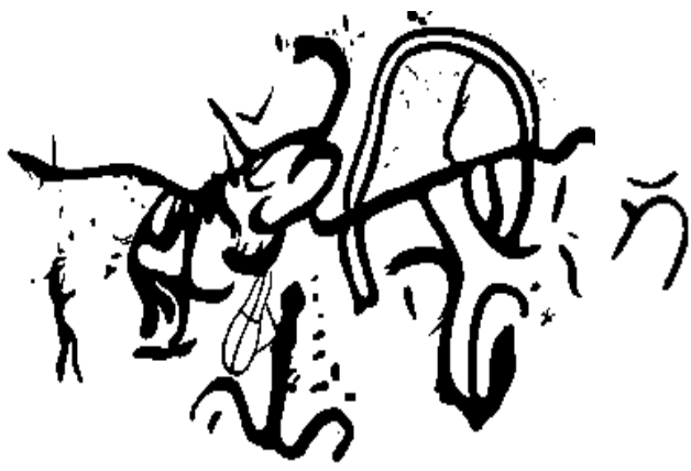
Рис. 1. Крещение в колыбели. Малый крест (Давид), большой - Мгер (Отец), справа лира, рядом звезда (Давида).