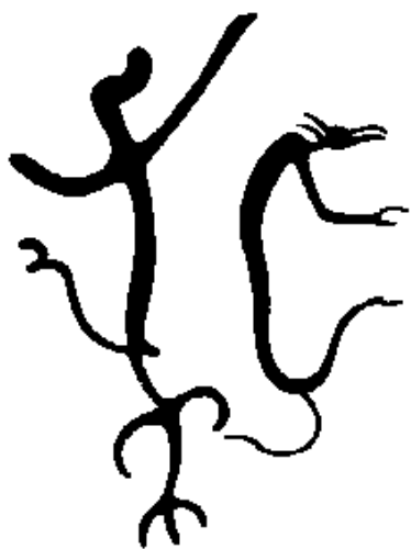
Рис. 3. Созвездия Дракона и Цефея.