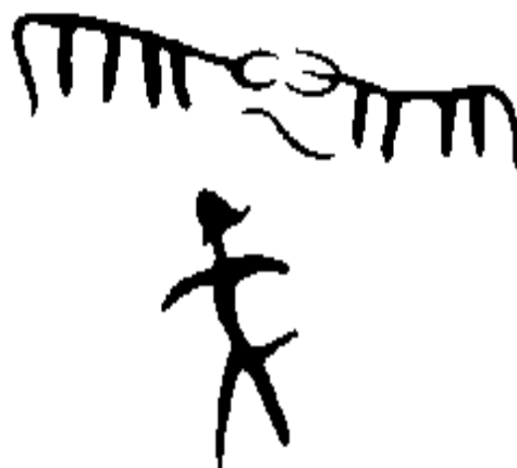
Рис. 4. Вечная борьба противоположностей, а человек – судья.