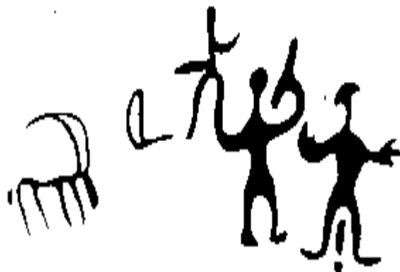
Рис. 8. Семья, младенец на руках у отца, который не скрывает своих чувств, справа счастливая мать.