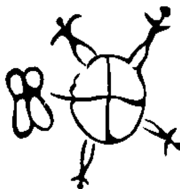
Рис. 2. "Сотворение" (арарум) Земля и рождение луны, четыре расы, четыре части света и крест – знаки происхождения жизни и развития.