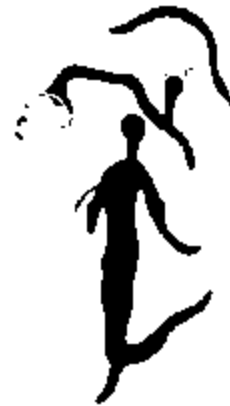
Рис. 6. "Мадонна".