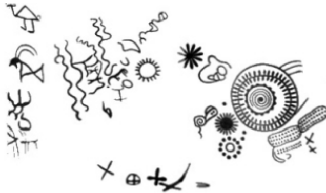
Рис. 7. Древний астрономический центр у подножия горы Севсар.