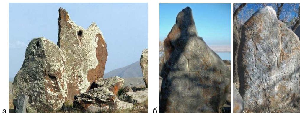
Рис. 3. (а) Каменные изваяния "Караундж" (Сюник, Армения). (б) Армянские кресткамни с острова Ахтамар, озеро Ван

Афродита на Кипре известна под именем " Vanassa ", которое современные лингвисты интерпретируют как " госпожа ". Имя богини Афродиты отражает один из ее титулов - " Пеннорожденная " (" афрос " - по гречески " пена ") и появляется намного позже, в античных текстах греческих авторов 8 века до н.э.