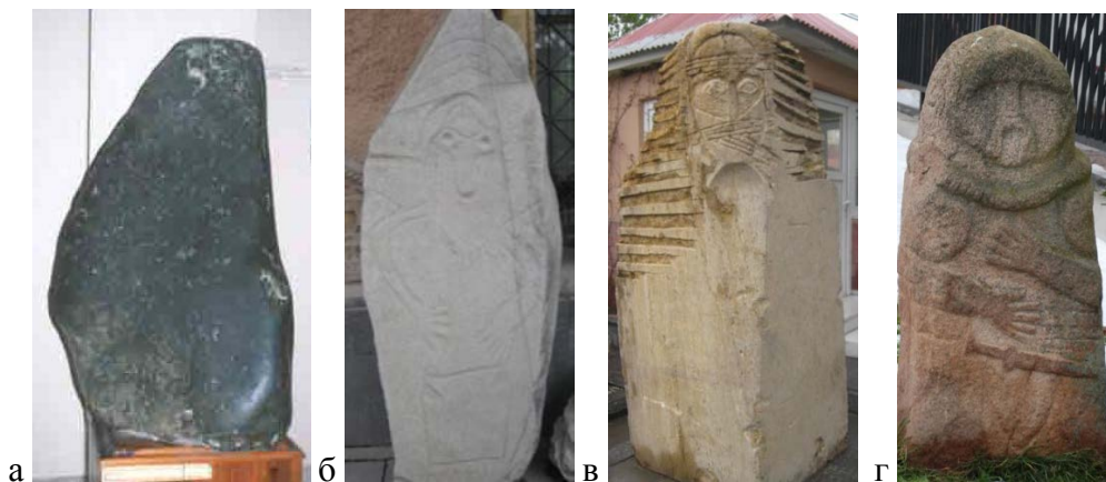
Рис. 2. (а) Сакральный центр святилища Афродиты - темный серо-зеленый конический камень 1.22 м в высоту называемый "карадаш" - "черный камень".

(б, в) Каменные плиты с изображениями во дворе Археологического музея города Ван, находки из района Хакьяри. Плиты относят примерно к 2000 годам до