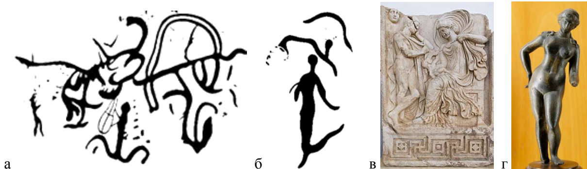
Рис. 4. (а) Богоматерь, наскальный рисунок, Армения, 7-5 тыс. до н.э. (б) Богиня плодородия Астхик - прототип Афродиты (Ванессы), Венеры, наскальный рисунок, Армения, 7-5 тыс. до

Имя Ванасса ассоциируется с принятым в латинской традиции именем богини " Venus ", которое намного более древнее, чем греческий аналог 37 . Самый ранний из известных поэтов, упоминающих Афродиту, Гомер жил на несколько столетий позже периода фактического зарождения культа (источник википедия). По мнению автора, названия материков Азия , Европа и Африка даны в честь женских богинь ( Асия , Ванесса (Европа) и Афрос ), которые связаны с более древней армянской богиней - Астхик . Наименования же стран, как правило, соответствовали мужским именам (первым правителям), например, Айастан происходит от Айка , Финикия - от Фойника , Киликия - от Килика , Армения - от Арама .