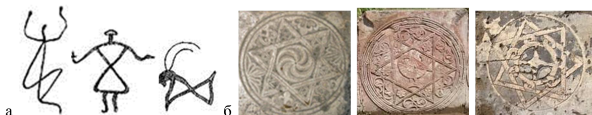
Рис. 2. Графическое изображение треугольников в армянских наскальных рисунках (а). Рельефные изображения двух треугольников, Армения (б)

Как армянский язык “ может все языки в себя вобрать ” 21 , так и концепт “ дом ” в своих архетипичных проявлениях охватывает как языковой аспект мышления древнего человека, так и его материальные и культурные проявления. Графическую модель концепта “ дом ” можно представить как в виде целостной системы – треугольника, так и отдельно взятых геометрических элементов его мотивов. Космогоническое представление концепта “ дом ” изначально принимает геометрическую, а позднее и орнаментальную форму в наскальных рисунках Армении. С формированием понятия “ дом ”, ранее неограниченные макрокосм и микрокосм обретают определенные границы “ замкнутого, защищенного места обитания ” (как своего, так и чужого). Встречаются как схематические рисунки геометрических фигур (треугольники, квадраты), так и образные наскальные изображения. Одной из типичных схем трансформации архетипа “ дом ” в армянской наскальной, изобразительной, орнаментальной и идеограммной символике является “ встреча двух треугольников ” 22 (рис. 2).