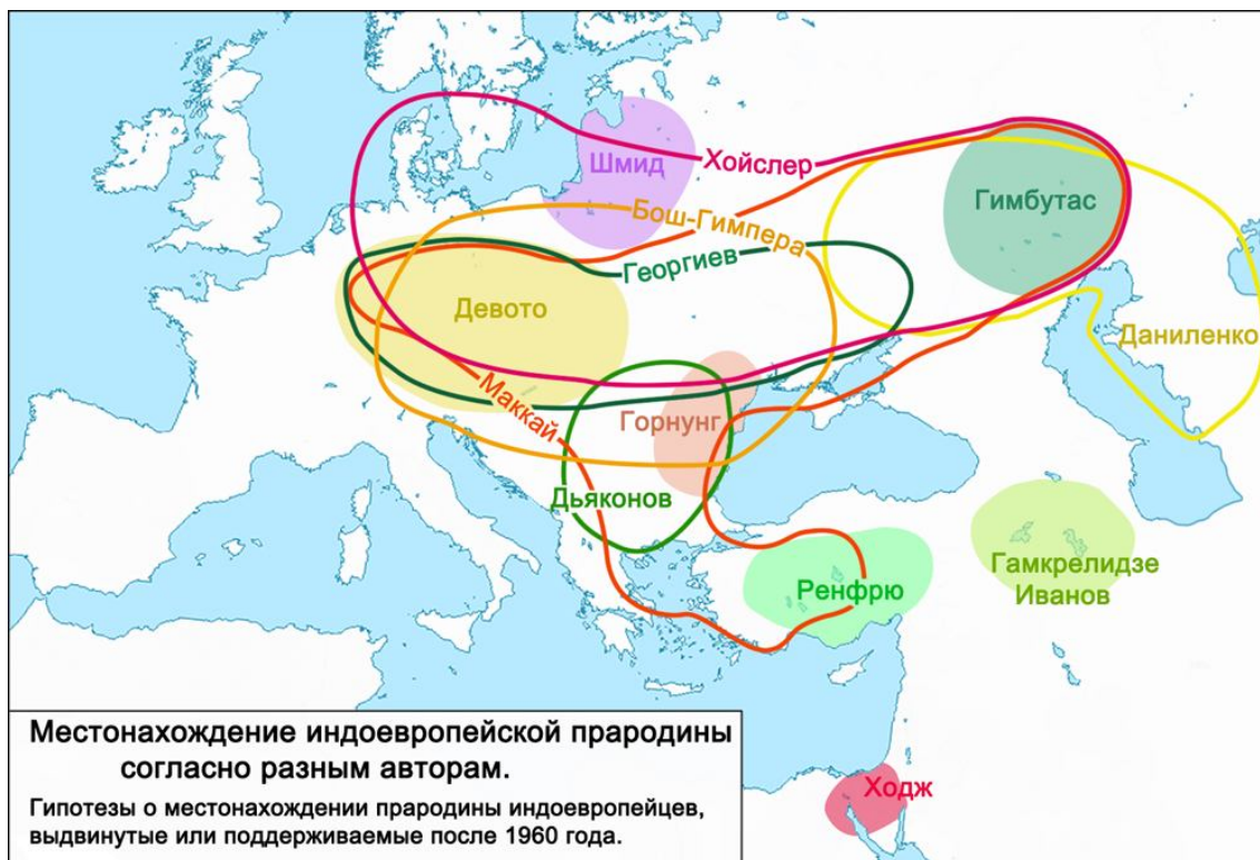
Рис. 1. Карта местонахождения индоевропейской прародины

Известны также следующие мифические прародины индоевропейцев: арктическая прародина ариев и их расселение; Асгард древних германцев и скандинавов – страна асов и ванов; отдалённые странствия в сказаниях готв; отдалённые странствия в греческой мифологии 2 .