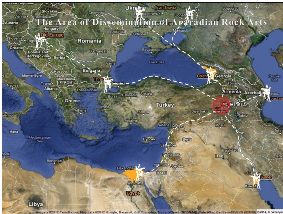
Рис. 2. Карта распространения древних знаний