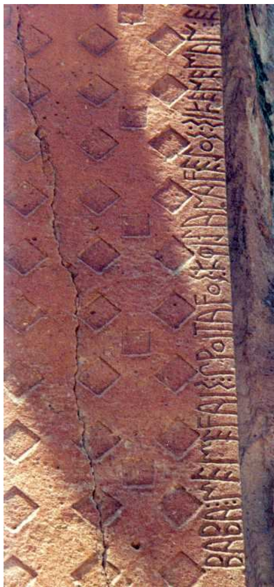
Надпись на могиле царя Мидаса (правая сторона) древнефригийский период

Об этом могут свидетельствовать следующие слова: один из главных богов фригии - Багайос (не только одного корня со славянским богом, но буквально переодится как Бог армянский – “Баг айоц” ( Бог не фригийский, а армянский ), ср. с именем древней столицы Армении – Багаран, а также Багават, с царским родом Багратуни, с вариациями слов сад – “бах”, “баг” (город Багдад), а также с тем фактом, что в райском саду текут реки, река на арм. буквально – “гет” и, как следствие, слово “айги” можно интерпретировать как Единое ( Одиное , божественное) место где текут реки, армянское слово “бахник” (букв. баня, ср. древнеармянским ջերմի “горячий” (*germ-). Имя Карабах на турецком “черный сад” (сад не может быть черным), однако на арм. каменный сад). Армянское слово “бах” заимствовано тюрками и используется в турецком языке в качестве значения слова сад, а типично армянское “кар” – в качестве значения слова черный). Фригийская богиня - мать Амма , заимствована с армянского Ам (ср. с “ам-ам” букв. кушать, есть) или Ан (ср. с с богинями Анаит и Астхик, именем Анна и названием столицы средневековой христианской Армении Ани ).