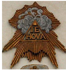
The name Iehova at a Norwegian church

Jehovah is a Latinization of the Hebrew, a vocalization of the Tetragrammaton יהוה (YHWH), the proper name of the God of Israel in the Hebrew Bible, which has also been transcribed as "Yehowah" or "Yahweh". The earliest available Latin text to use a vocalization similar to Jehovah dates from the 13th century. Most scholars believe "Jehovah" to be a late (c. 1100 CE) hybrid form derived by combining the Latin letters JHVH with the vowels of Adonai , but there is some evidence that it may already have been in use in Late Antiquity (5th century). Others say that it is the pronunciation Yahweh that is testified in both Christian and pagan texts of the early Christian era. The consensus among scholars is that the historical vocalization of the Tetragrammaton at the time of the redaction of the Torah (6th century BCE) is most likely Yahweh , however there is disagreement. The historical vocalization was lost because in Second Temple Judaism, during the 3rd to 2nd centuries BCE, the pronunciation of the Tetragrammaton came to be avoided, being substituted with Adonai ("my Lord").