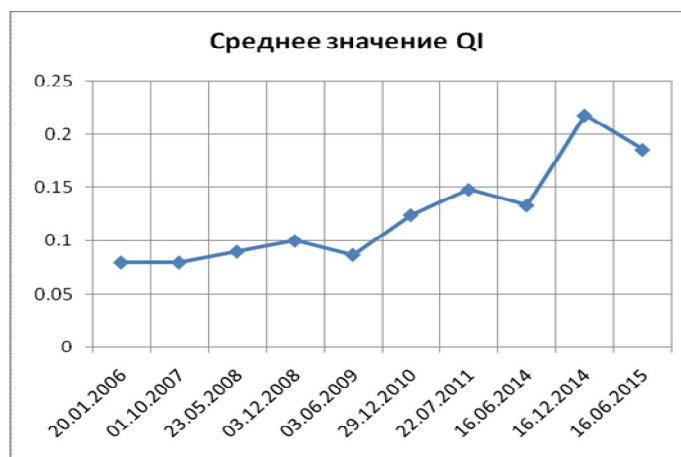
Диаграмма 3. QI сети инновационных центров России

Целью создания фонда, объем капитализации которого составит 315 млрд евро, является восстановление посткризисного роста экономики Евросоюза. Предполагается, что средства фонда будут вкладываться в проекты в сфере создания стратегической энергетической, транспортной и электронно-цифровой инфраструктуры в Европе, развитие отдельных направлений образования и исследований, развитие инновационных, экологически чистых технологий, а также подразумевает финансирование проектов, направленных на поддержку малого бизнеса”, http://vz.ru/news/2015/7/22/757430.html .