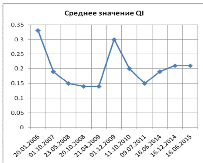
Диаграмма 2. QI ведущих российских коммерческих организаций

“Падение рубля, по оценкам экспертов, связано с обвалом мировых цен на нефть, а также с ухудшением настроений инвесторов по всему миру из-за роста волатильности рынков капитала. На нефтяном рынке во вторник сохраняется отрицательная динамика цен на опасениях чрезмерного предложения топлива в США и сокращения спроса в Китае”, http://www.interfax.ru/business/456617 .