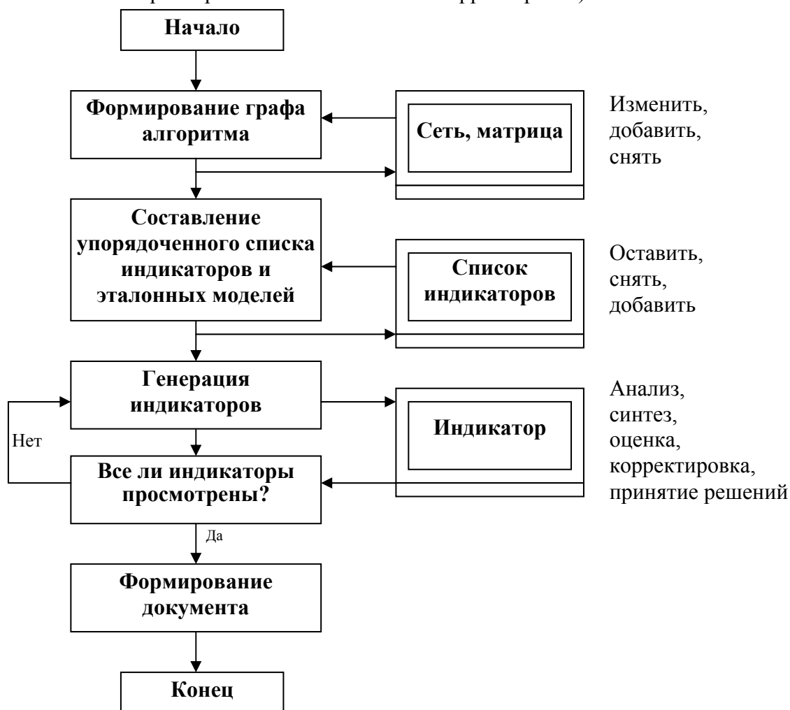
Рис. 2. Схема организации решения задач

б) «Прекратить вычисления» (по этому указанию происходит ограничение области изменения параметров или выполняется ее корректировка).