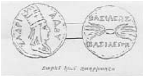
Зарех или Зариадрис, царь Софены

Сохранилось свидетельство крупнейшего античного географа Страбона о том, как, воспользовавшись поражением Антиоха III-его в битве при Магнесии (190-ый год до нашей эры) с набирающими мощь римлянами, Арташес и Зарех перешли на сторону римлян и с их помощью в 189 году до нашей эры объявили себя царями.